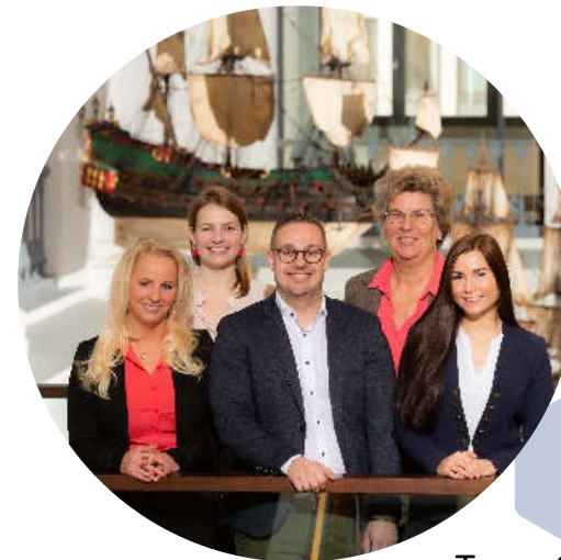
Team Gründungszentrum Handelskammer Hamburg

Gründungshotline: 040 361 38 - 128 E-Mail: gruendung@hk24.de