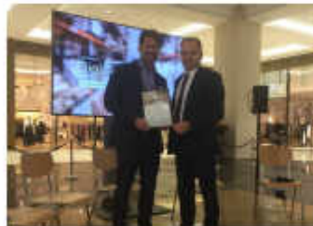
Cisco Digital Pitch 2016 Smart Retail 1. Platz