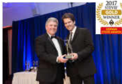
German Stevie Awards 2017 Stevie Winner – Best App - Shopping