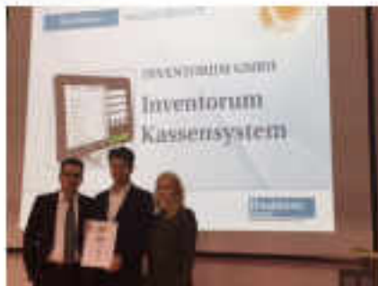
Handelsblatt/EuroCIS Top Produkt Handel 2015