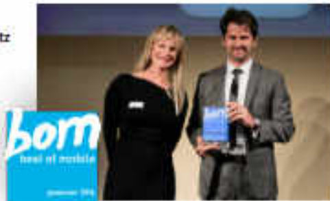
M-Days 2014 Best of Mobile 1. Platz